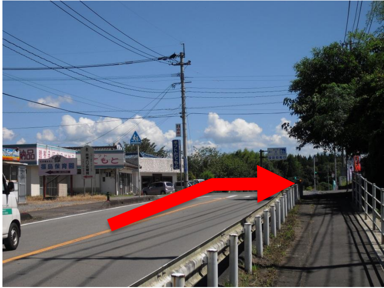
①チクキョウミート前