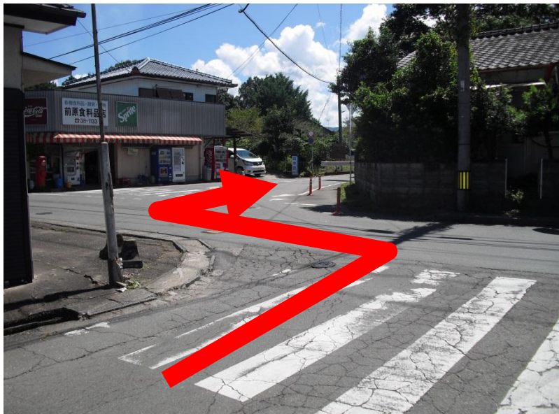
②前原商店前交差点付近