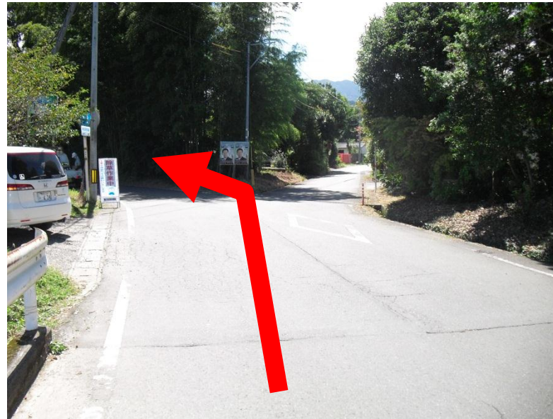
③くれよんのもり前Y字路