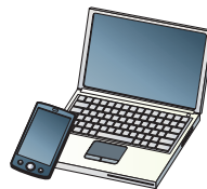
インターネット・気象庁ホームページ